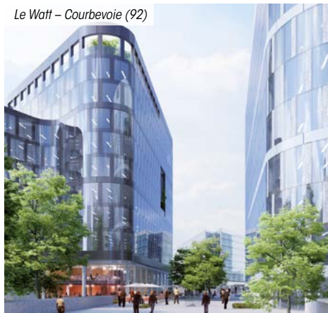
Le Watt – Courbevoie (92)

*** Pour les non résidents seuls les immeubles détenus en France sont pris en compte.